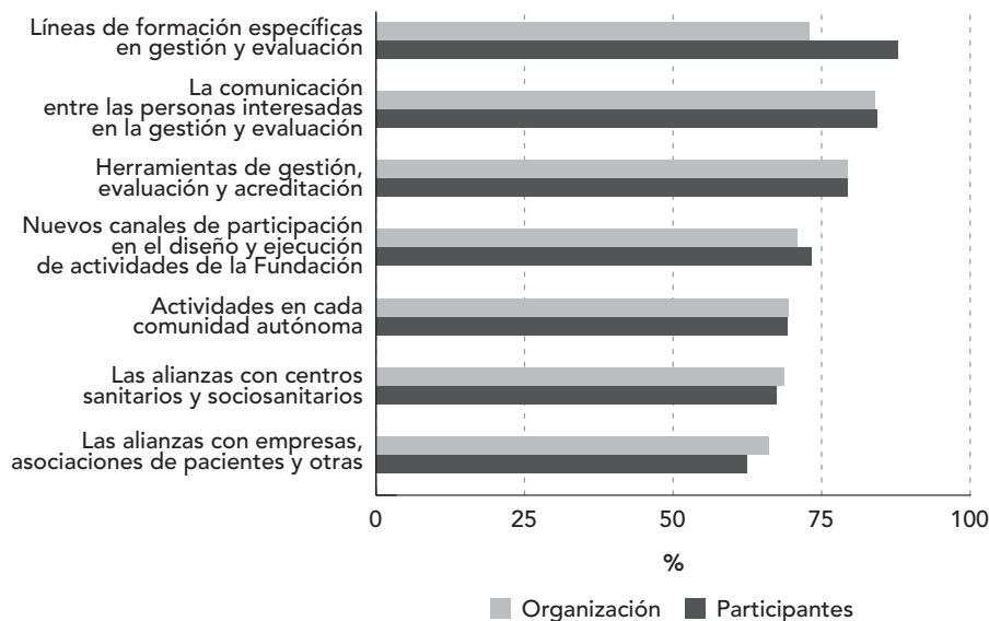
Figura 2. ¿Qué debería promocionar la Fundación?