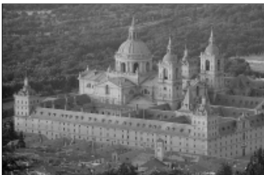
Monasterio de El Escorial.

Que se vuelve a hablar del SIGNO, qué tiempos aquellos, primero Hellín, luego Oviedo, La Coruña y Las Palmas de Gran Canaria... Tantas citas y tantos recuerdos, los proyectos de auditoría, las larguísimas discusiones, las presentaciones..., por qué no decirlo, los amigos.