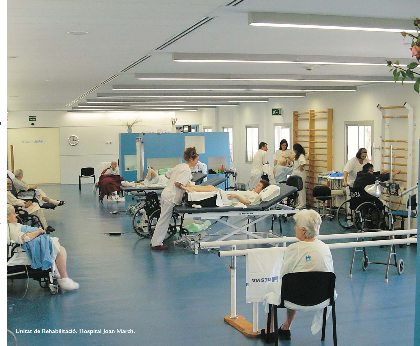
Unitat de Rehabilitació. Hospital Joan March.